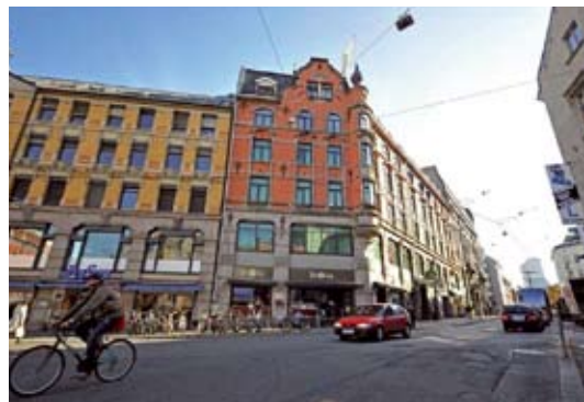
MØTESTED: Årsmøtet avholdes på P-Hotels i Oslo.

De som ønsker en papirversjon hjemsendt bes ta kontakt enten på e-post, brev eller på tlf. 97 00 86 13. ●