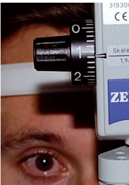
SJEKK: Undersøkeren kan lese av og måle ulike resultater.

"Jeg har sluttet å spørre, sa en pasient til meg en dag. Jeg forstår ikke måten det blir forklart på likevel."