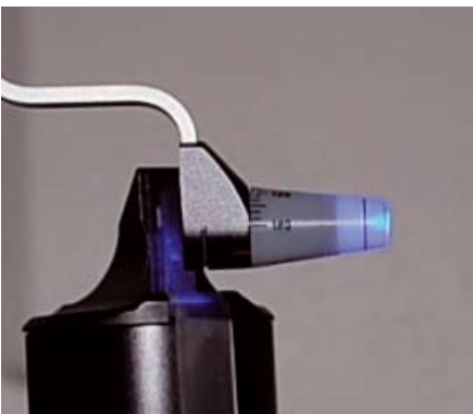
PROBE: Bedøvelse av øyet er nødvendig da en probe (bildet) berører hornhinnen.

Dette registrer undersøker ved at han/hun ser to gule ringer i mikroskopet. Disse skal møtes på en bestemt måte (se bilde) slik at trykket da kan leses av på en skala.