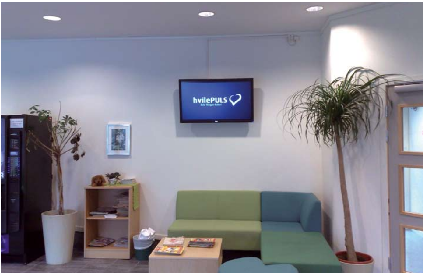
OPPMERKSOMHET: Reklame for Norsk Glaukomforening blir å se på slike skjermer på venterommet til 2500 leger i Norge.