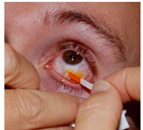
GULT: Før trykkmålingen legges en gulffarge på øyet (Fluoresin).