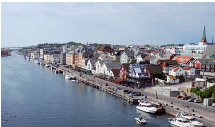
HAUGESUND: I mars blir det folkemøte i Haugesund.

Siden 2006 har Norsk Glaukomforening arrangert folkeopplysningsmøter i hele Norge. I 2013 vil det bli arrangert folkemøte i Lillestrøm i januar, Haugesund i mars og Trondheim i oktober. Her vil det bli foredrag med øyelege, god tid til spørsmål fra salen til øyelegen og informasjon om Norsk Glaukomforening. Mer informasjon om tid, sted og foredragsholdere for folkemøtene vil bli publisert fortløpende på foreningens hjemmeside, annonsert i lokale medier og i utsendt invitasjon til lokale medlemmer. ●