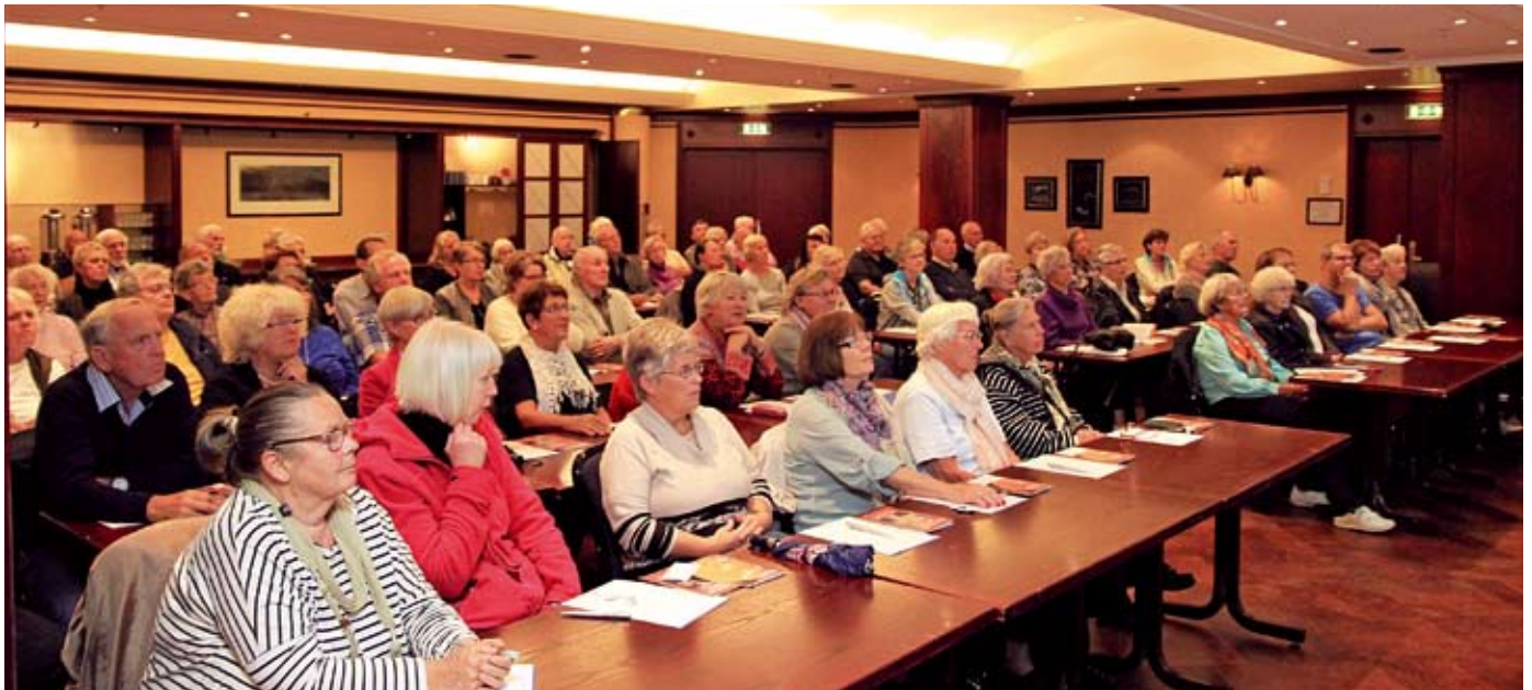
FOLKSOMT: 80 personer tok turen til folkemøtet i Kristiansand.

Kalenderen viser 27. september, og klokken nærmer seg 18.00. Håkonsalen på Hotell Norge i Kristiansand sentrum er allerede fylt til randen, og det må settes inn ekstra stoler for å få plass til alle. Over 80 sørlendinger har tatt turen til Norsk Glaukomforenings folkemøte denne høstkvalden.