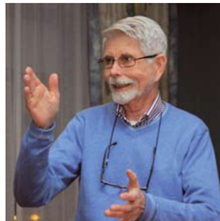
OPPFORDRING: Leder i Norsk Glaukomforening håper flere melder seg til å ville være med i styret.

Hvis du kan tenke deg dette, eller ønsker mer informasjon så ta kontakt med valgkomiteen ved Per Kaland på telefon 97 00 86 13. ●