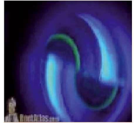
RINGER: Disse gule ringene skal møtes på en bestemt måte.

resultat. Kanskje må man legge på mer fluoresinfarge og den som måles må blunke litt ekstra for å oppnå rett tykkelse på ringene. Ikke slutt å stille spørsmål.