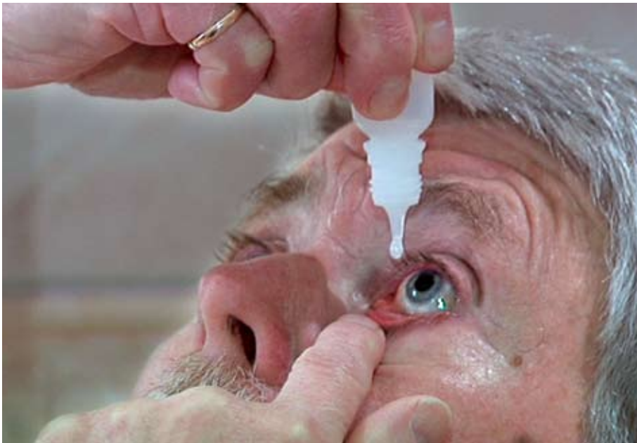
I en fersk studie fra USA ble det funnet at 97% av pasientene som kun sto på prostaglandin (Xalatan, Travatan, Lumigan) en gang daglig hadde mindre enn 5 utelatte dryppinger over en 60 dagers periode. Tillegg av et annet medikament førte til at 37% av pasientene hadde mer enn 5 doseringsfeil i løpet av 60 dager.

I augustnummeret av øyelegetidsskriftet Ophthalmology står en lang artikkel om adherence , basert på intervjuer med 300 pasienter. En hovedkonklusjon var at god kommunikasjon mellom doktor og pasient var av stor betydning for om pasientene vedble å dryppe som forskrevet. Videre var pasientenes kunnskap og tro om glaukom vesentlig. Pasienter som var mindre bekymret for fremtidig skade av glaukom og risikoen ved ikke å ta dråpene hadde dårligere adherence. Særlig avgjørende var kunnskap om mulig synstap p.g.a. glaukom.