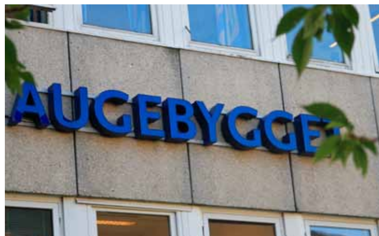
STORT: Øyeavdelingen på Haukeland Universitetssykehus har omlag 100 ansatte.