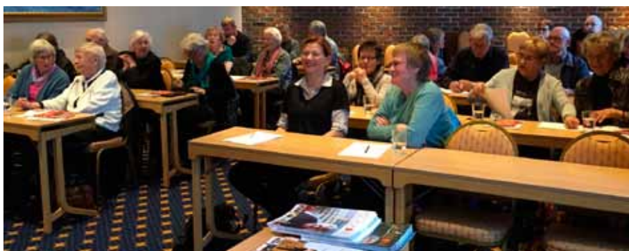
I HAMMERFEST: Det var stort engasjement og mange spørsmål fra salen.

– Totalt sett er vi svært fornøyd med møteuken i nord, legger han til. ■